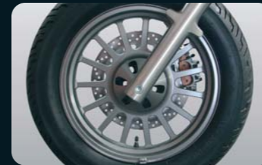
Gussfelge vorne (nur bei 2-farbiger Lackierung)