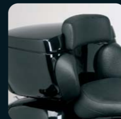
Topcase mit Rückenpolster