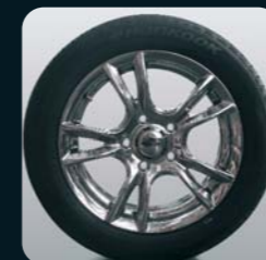
Alufelgen hinten, Chrom-Look