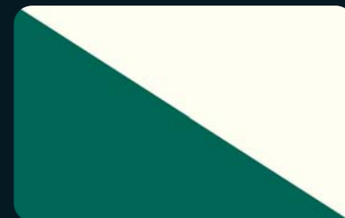
Grün / Weiß

Die hier abgebildeten Karosseriefarben können aus drucktechnischen Gründen geringfügig von den tatsächlichen Farben abweichen.